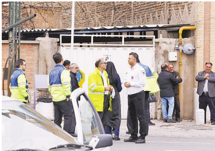
Tragédia ocorreu em uma região montanhosa, de difícil acesso