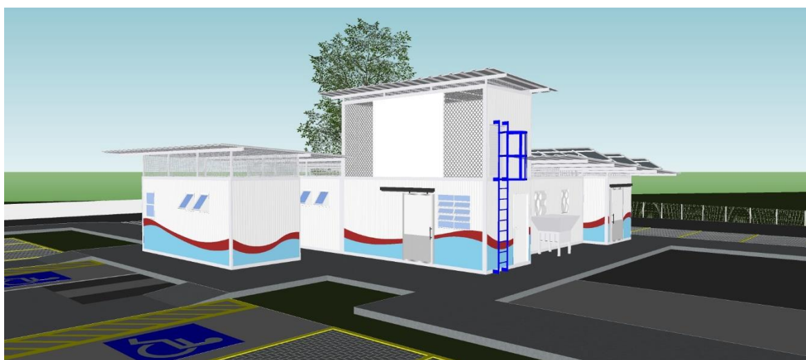
Figura 4 - Vista da fachada do Edifício do Entrepasto.

Externamente, uma vez que os painéis autoportantes já serão pré-pintados, a edificação receberá adesivos vinílicos nas cores azul claro e vermelho, resistentes ao sol e demais intempéries, que poderão ter grafismos que representem a atividade e natureza da edificação.