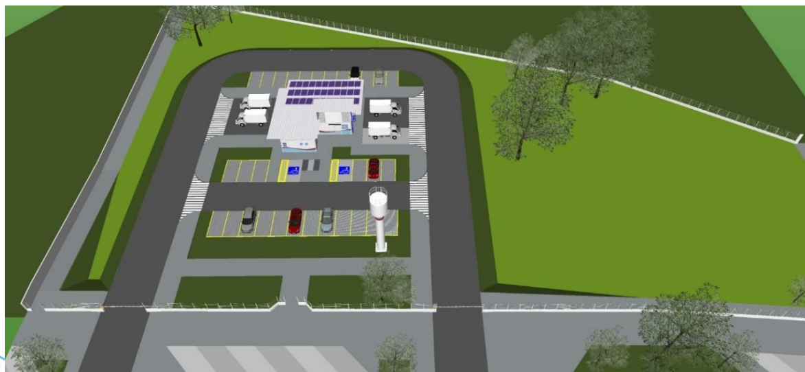
Figura 3- Visão aérea geral do Entrepósito.

O projeto foi totalmente concebido para ser executado em módulos de painel isotérmico nas dimensões externas de 6,00m x 2,50m, com altura útil interna de 2,50m e externa de 2,75m. A escolha do