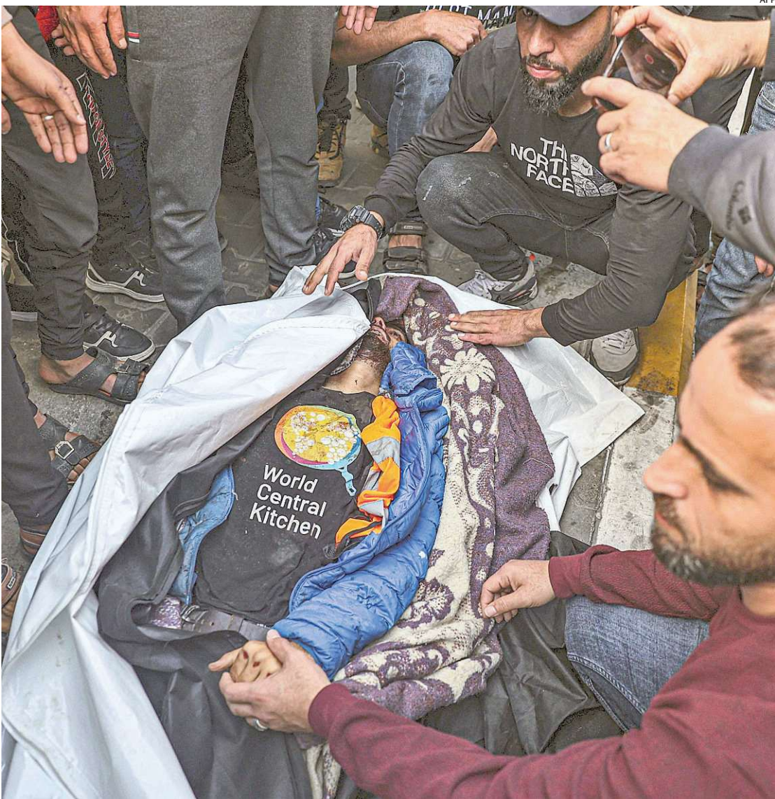
Um dos funcionários da ONG que distribui comida atingido pelo ataque israelense em Gaza

“Estou com o coração partido e de luto pelas famílias e amigos e por toda a família”, escreveu o chef, que prosseguiu: “O governo israelense deve parar com essa matança indiscriminada. Deve parar de restringir a ajuda humanitária, parar de matar civis e trabalhadores humanitários e parar de usar os alimentos como arma.” ✖