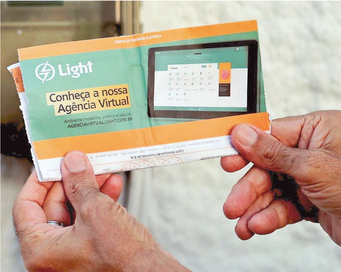
Projeto será aplicado a 10 mil clientes, que ainda serão escolhidos, com duração de 36 meses

tos de energia). A holding que controla a geradora e distribuidora de energia está em recuperação judicial desde junho deste ano. A proposta também estabeleceu divisão entre o público-alvo: consumidores regulares (em conformidade com as normas de consumo e pagamento) e irregulares (os que foram identificados com práticas irregulares nos últimos 24 meses e regularizados recentemente).