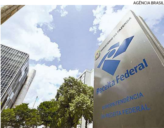
Sede da Receita Federal, em Brasília

► Beneficiários de pensão por morte de servidor federal civil vinculados ao Regime Próprio da Previdência Social (RPPS) passarão por uma mudança no cálculo da contribuição previdenciária para o Plano de Seguridade Social (PSS). A Receita Federal determinou a correção para garantir que o desconto seja sobre o valor total da pensão, antes do rateio entre os beneficiários. A alteração vai impactar pensionistas que recebem valores superiores a R$ 7.786,02 e compartilham o benefício com pelo menos uma pessoa. A medida entra em vigor na folha de pagamento de setembro, com reflexos financeiros a partir de outubro de 2024. Até o momento, o desconto da contribuição para o PSS era feito individualmente sobre a cota-parte de cada pensionista, ou seja, após o rateio. Com a nova regra, pensionistas federais que compartilham o benefício podem ter aumento nos descontos em seus proventos. Aqueles que recebem cotas menores do que o valor de isenção podem passar a contribuir, dependendo do valor total da pensão compartilhada.