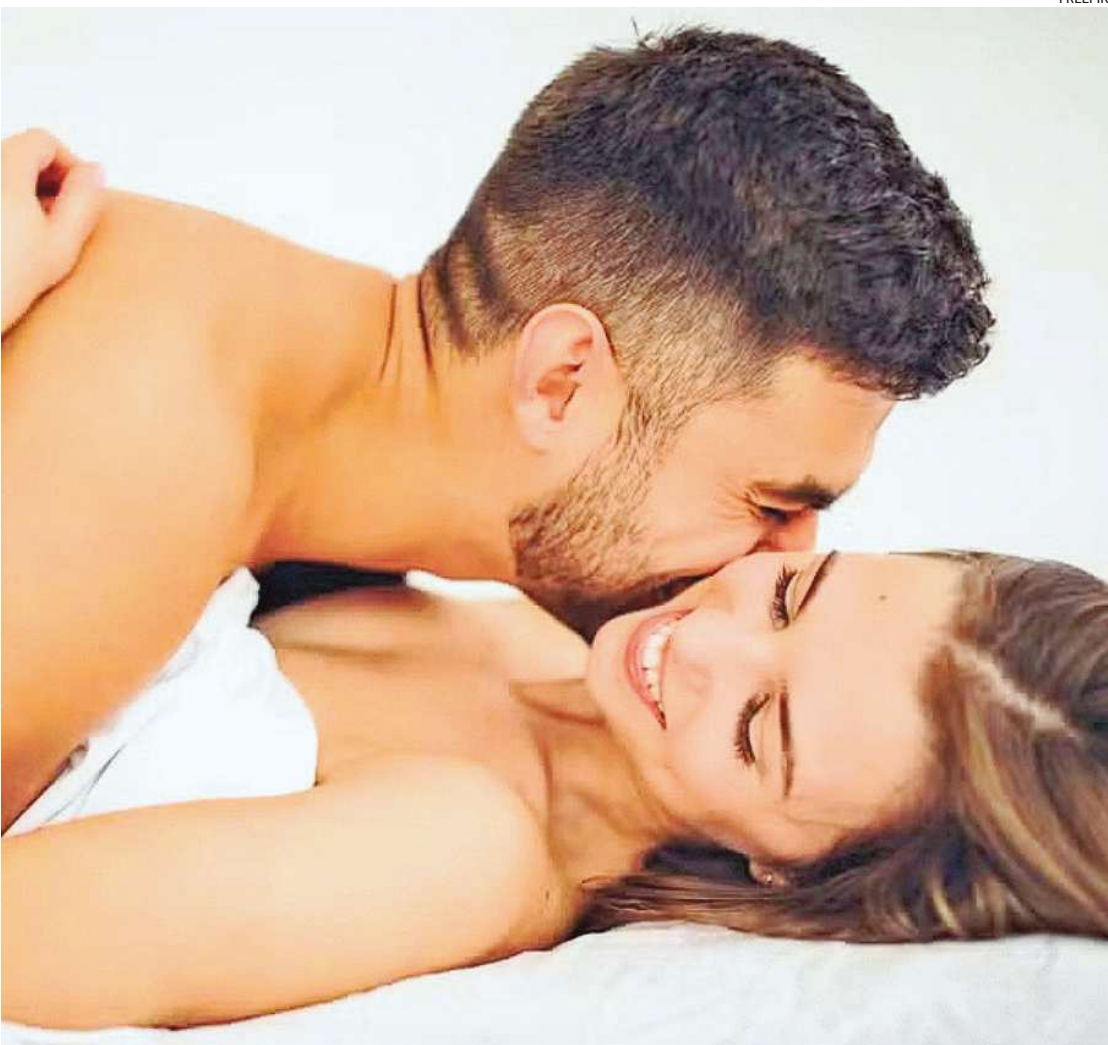
Posição conhecida como “papai e mamãe” é a melhor para o orgasmo feminino, segundo estudo

O estudo foi publicado no Journal of Sexual Medicine. Para realizar a pesquisa, os estudiosos americanos exa-