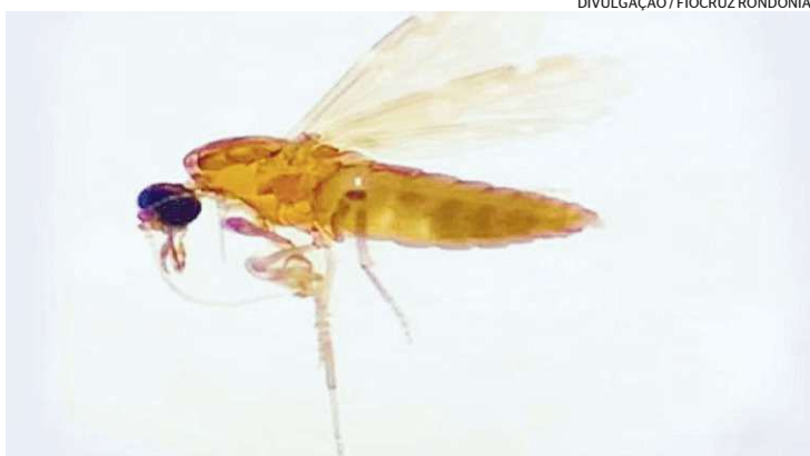
Mosquito transmite o vírus que causa a febre oropouche

— Exames apontaram a existência de material genético do vírus em diferentes tecidos do bebê, que nasceu com microcefalia, malformação das articulações e outras anomalias congênicas. A análise também descartou outras hipóteses diagnósticas. No entanto, a correlação direta da contaminação vertical de Oropouche com as anomalias ainda precisa de uma investi-