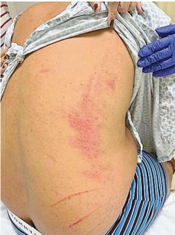
Leonel sofreu fraturas no rosto e machucados no corpo após tumulto com Amorim na Tijuca