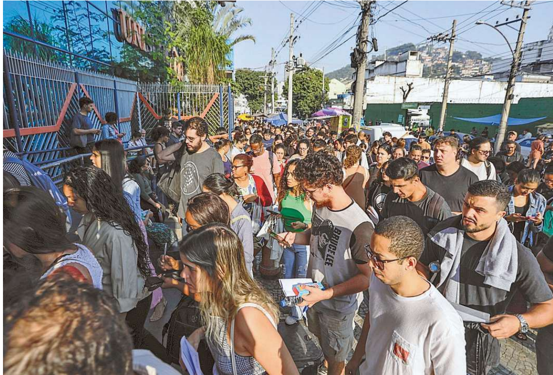
O Concurso Nacional Unificado foi em 18 de agosto, com 6.640 vagas para o serviço público